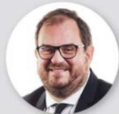
OPTO DISPLAY LCD Michele Giusti